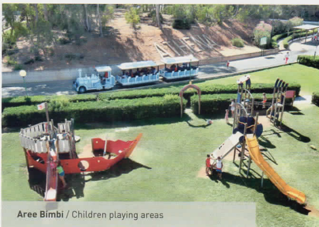
Aree Bimbi / Children playing areas

Athena Resort dispone inoltre di 8 campi da tennis illuminati in notturna, 4 campi di bocce, tiro con l'arco, campo basket, campo volley, minigolf, canoa, pedalò, noleggio auto, parking non custodito all'interno del complesso, 2 parchi giochi per i bambini, Mini Club con piscina e ampi locali dedicati, Baby Club e Junior Club, con assistenza e animazione riservata a pranzo e cena per intrattenere al meglio i piccoli ospiti. All'interno del caseggiato storico è conservata una piccola cappella per la celebrazione della messa domenicale, per tutto il periodo estivo.