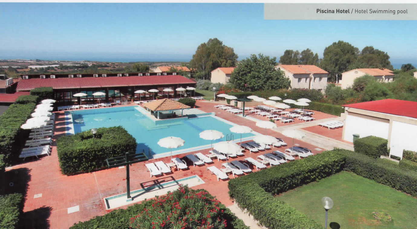
Piscina Hotel / Hotel Swimming pool