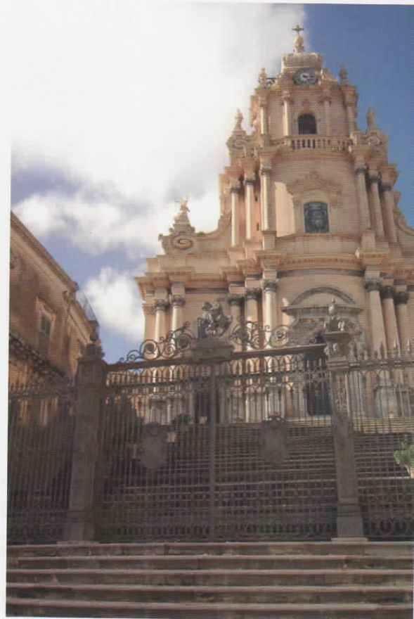
Duomo San Giorgio - Ragusa Ibla / San Giorgio's Cathedral- Ragusa Ibla