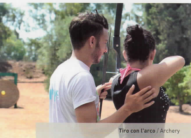
Tiro con l'arco / Archery