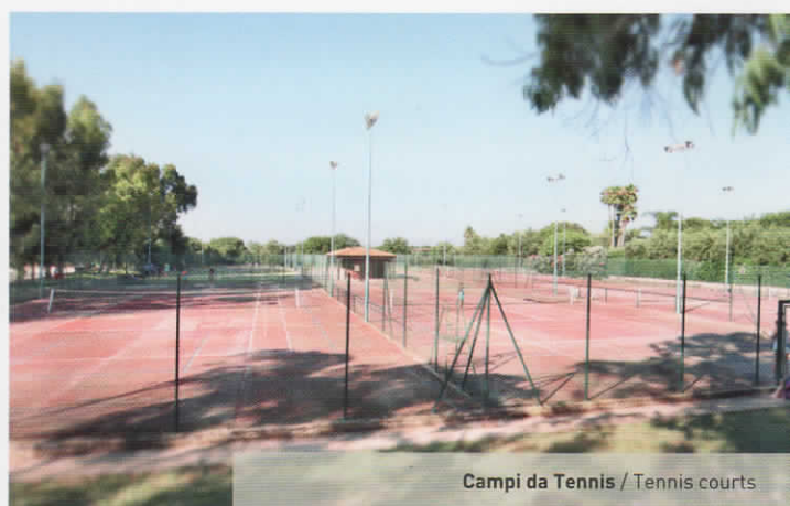
Campi da Tennis / Tennis courts