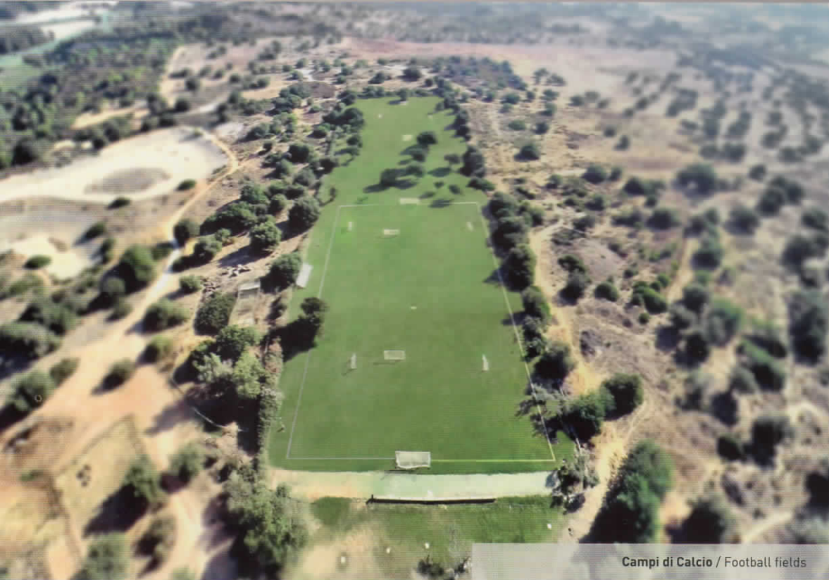
Campi di Calcio / Football fields