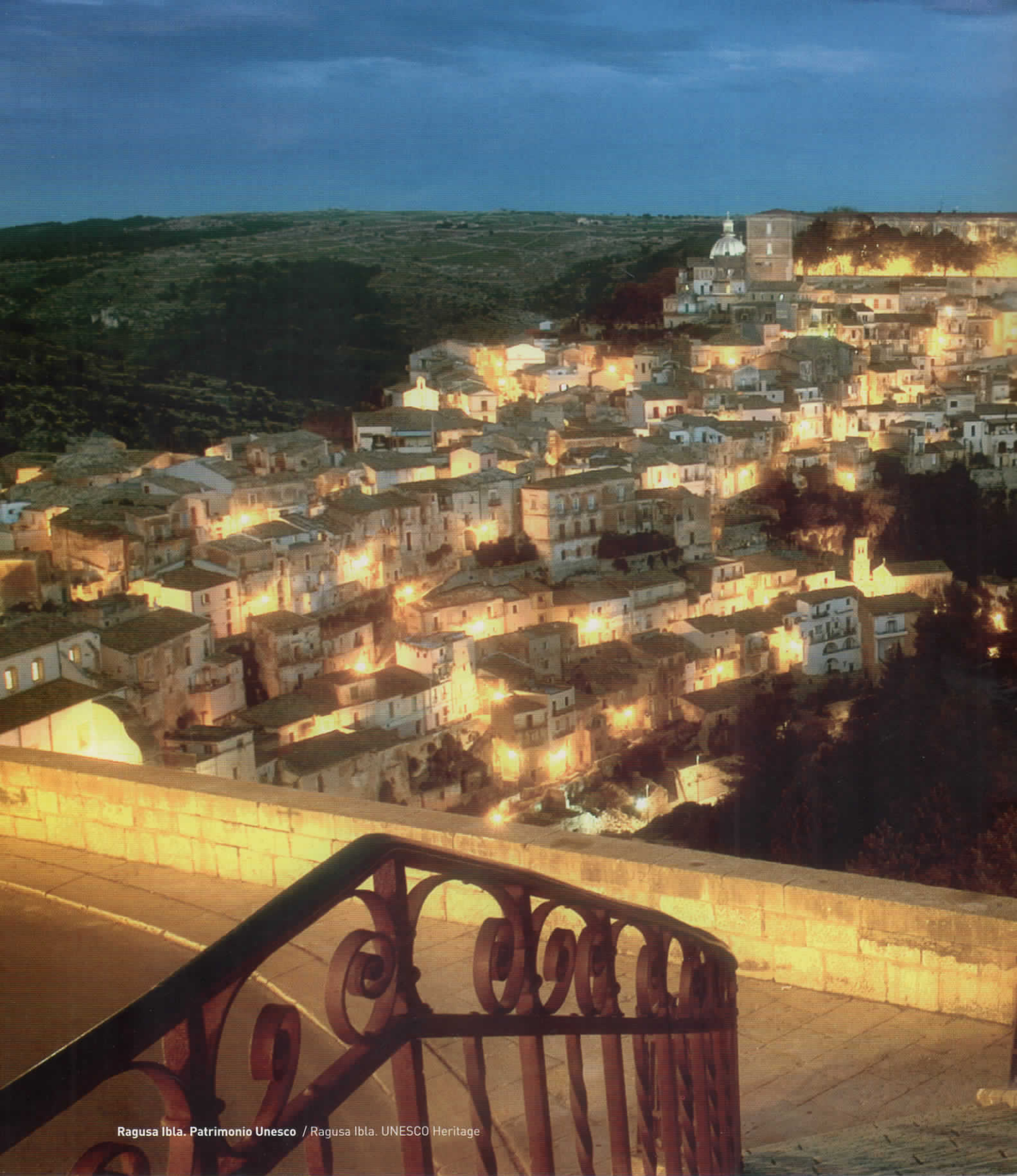
Ragusa Ibla. Patrimonio Unesco / Ragusa Ibla. UNESCO Heritage