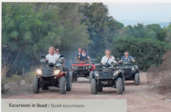
Escursioni in Quad / Quad excursions