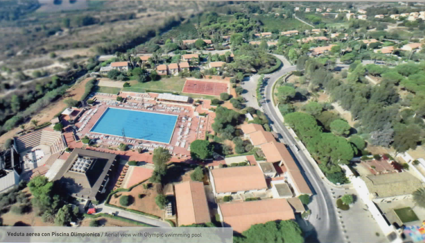
Veduta aerea con Piscina Olimpionica / Aerial view with Olympic swimming pool