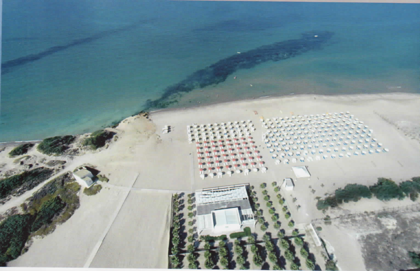
Spiaggia privata Athena Resort / Athena Resort Private beach